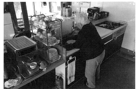
写真9 食べ終わった食器を洗う高齢の女性