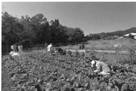
写真11 休耕地を利用した農園