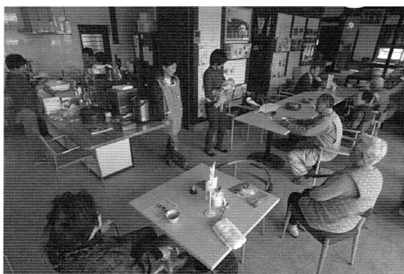
写真3 思い思いに過ごす人々