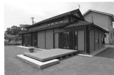
写真1 「居場所ハウス」外観