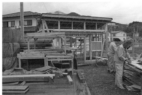
写真8 屋外のキッチンの建設

技をいかすことだけに限らない。運営当番が調理に忙しい時には食事を運んだり、食べ終わった食器を洗ったり（写真9）、お茶を出したり、薪ストーブに薪をくべたりする人もいる。朝市などで販売するための干し柿作り、クルミの殻割り、椿の実の殻取りなどを行う人もいる（写真10）。