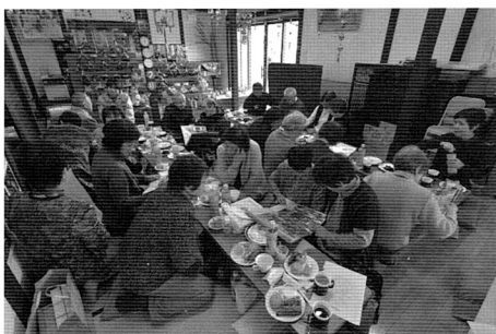
写真7 山岸仮設の元住民による同窓会

「居場所ハウス」がオープンするまでに、1年以上かけて住民を交えたワークショップが開かれた。Ibashoの8理念を共有したり、運営内容や建物について意見交換したり、自分がどのような役割を担えるかを紹介し合ったりするワークショップである。