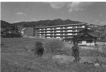
写真2 55戸の災害公営住宅「平南アパート」

たとえ同じプログラムに参加していなくても、互いを認識しあっていることで、緩やかな見守りにつながる。実際に、いつも来ている人がしばらく姿を見せないと、心配して電話したり、家に様子を見に行ったりしたこともある。最初から交流を目的とするプログラムを提供するのではなく、まず人々が居合わせる状況を実現すること。これが結果として多様な関わりにつながる可能性がある。