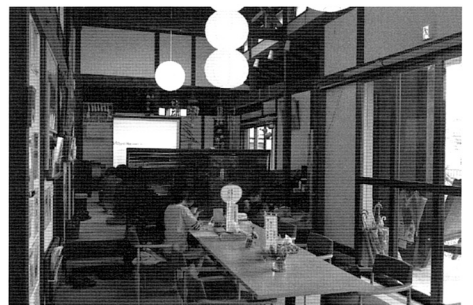
写真6 歌声喫茶(奥)の隣で勉強する中学生(手前)