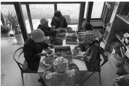
写真10 運営当番と来訪者によるクルミむき