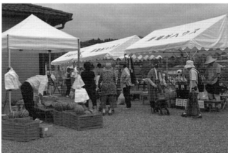
写真4 毎月の朝市は買い物客で賑わう